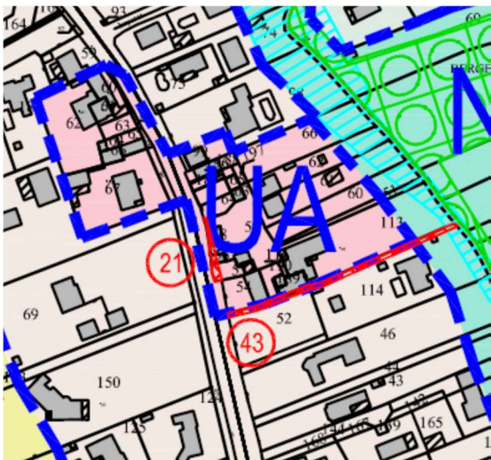
Extrait du zonage avant modification